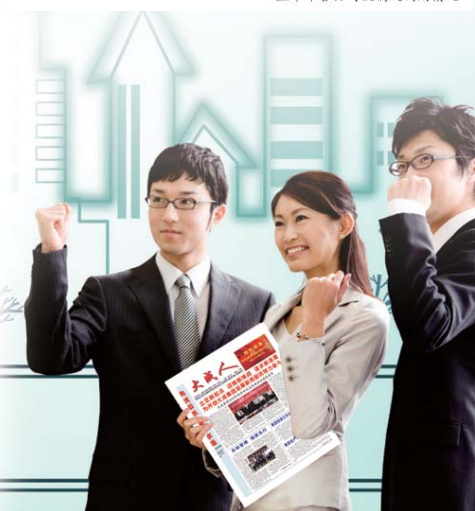
★上半年各公司投稿及利用情况